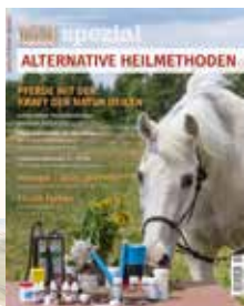
Format: 21 cm x 26 cm 96 Seiten, Klappenbroschur ISBN 978-3-95847-102-3 9,80 €