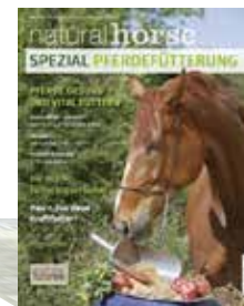
Format: 21 cm x 26 cm 96 Seiten, Klappenbroschur ISBN 978-3-95847-101-6 9,80 €

Diese Ausgabe gibt Einblicke in alle wesentlichen alternativen Heilmethoden.