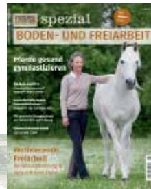
Format: 21 cm x 26 cm 80 Seiten, Klappenbroschur ISBN 978-3-95847-104-7 10,80 €