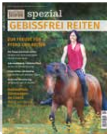
Format: 21 cm x 26 cm 80 Seiten, Klappenbroschur ISBN 978-3-95847-103-0 9,80 €